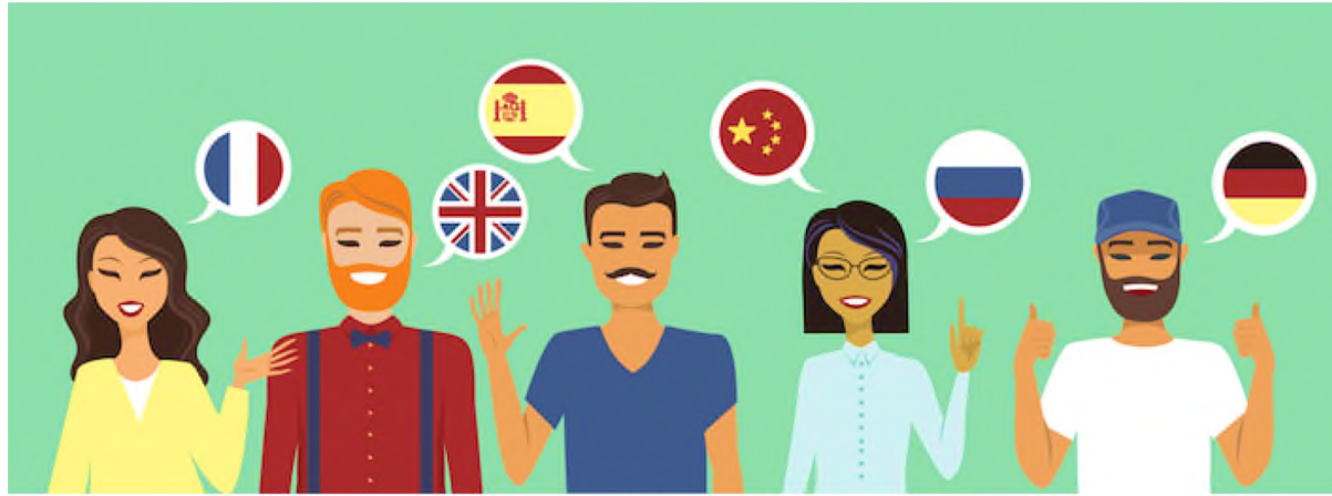
Bonne maîtrise de l'anglais